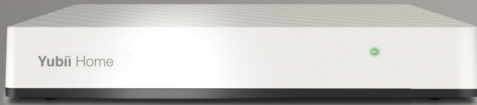
Yubii Home Gateway