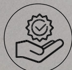
Stabilität und Zuverlässigkeit