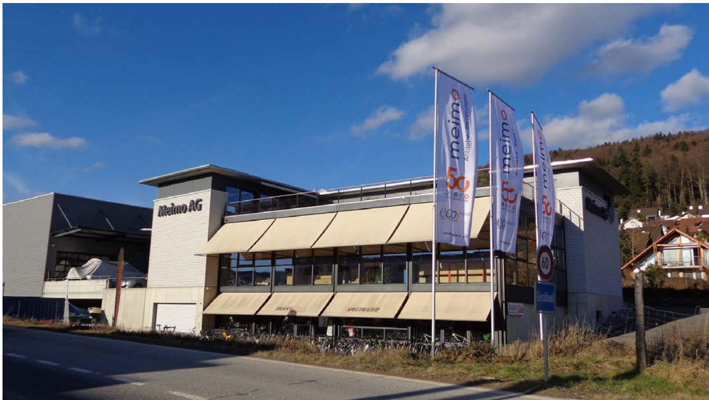
Nach nur 14-monatiger Bauzeit konnte 2003 der neue Firmensitz in Geroldswil bezogen werden.

sächlich Elektroinstallateure anstellen, sind wir natürlich auch darauf angewiesen, dass andere Firmen ebenfalls ihrer Verantwortung nachkommen.